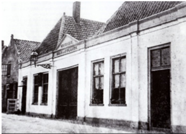
Entree begraafplaats (ca. 1900)