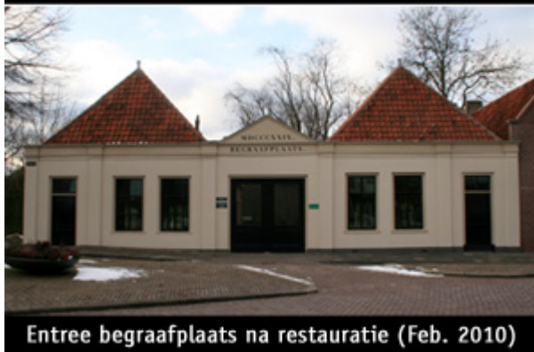
Entree begraafplaats na restauratie (Feb. 2010)